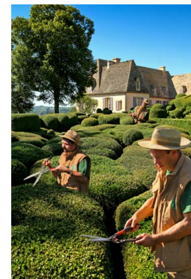
LA TAILLE DES BUIS À LA CISAILLE

l'asile du Poète, les sculptures d'Alain de Cerval, descendant du créateur des jardins, les têtes minérales ciselées à fleur de terre invitent les uns à la curiosité, les autres à la méditation et les plus jeunes à une irrésistible envie de gambader.