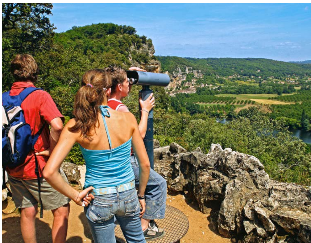
LA VUE PANORAMIQUE SUR VALLÉE DEPUIS LA CABANE EN CLOCHE

dépasser les 10 mètres de haut !), tous défont les saisons en gardant leur feuillage toute l'année. Dans leur grande majorité, les buis de Marqueyssac ont été plantés durant la seconde moitié du XIX e siècle par Julien de Cerval et sont entièrement taillés à la main deux fois par an. Adaptés au sol de ce promontoire rocheux, les buis de Marqueyssac sont particulièrement mis en valeur sur le Bastion en une multitude de petites collines qui répondent aux reliefs naturels de la vallée, mais aussi au travers du « Chaos », une vision contemporaine et artistiquement déstructurée de l'art topiaire. Les Jardins de Marqueyssac sont d'ailleurs membre de l'European Boxwood and Topiary Society.