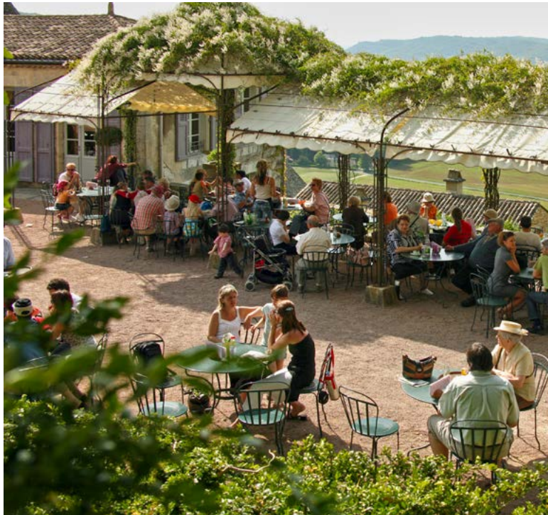
LA TERRASSE PANORAMIQUE DU RESTAURANT

Pour les amateurs d'ouvrages sur les arbres, les plantes, l'art des jardins et la nature - avec des étagères consacrées aux éditions pour les enfants - comme pour ceux qui aiment les livres sur les coutumes, les traditions et l'art de vivre de la région... Mais aussi pour ceux qui recherchent des objets de décoration qui sortent de l'ordinaire, dont une belle collection déco en buis... La boutique-librairie de Marqueyssac est un passage obligé !