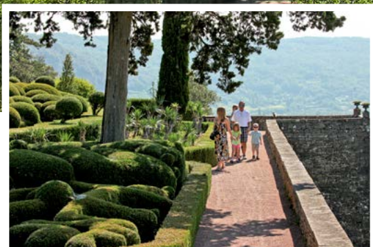
UNE ALLÉE DU BASTION