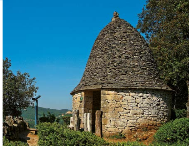
LA CABANE EN CLOCHE