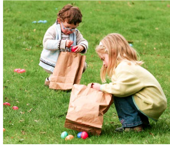
LA CHASSE AUX OEUFES

une seconde vie. Très prisé par les tourneurs comme les sculpteurs et les graveurs qui apprécient sa couleur d'or et son grain si fin qui lui confère un poli très doux, le buis de Marqueyssac se décline sous bien des aspects. Les objets tournés sous les yeux des visiteurs sont présentés et vendus dans la boutique des jardins.