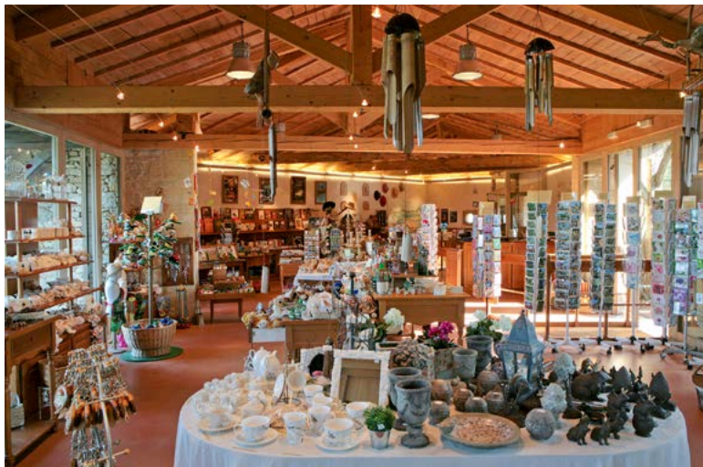
LA LIBRAIRIE BOUTIQUE