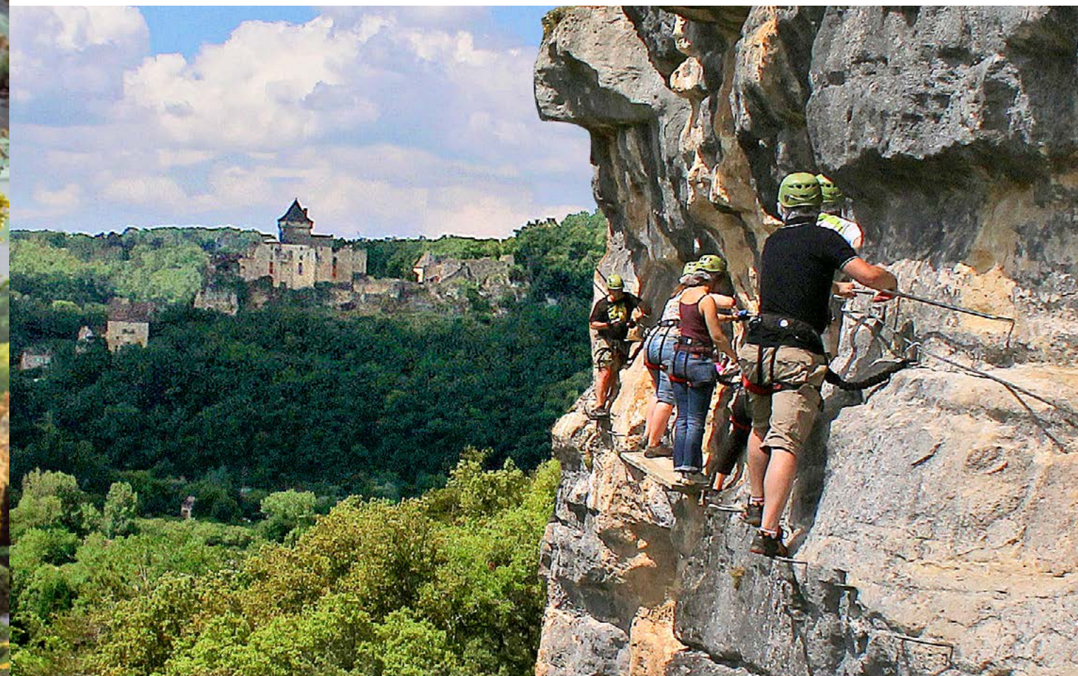
LA VIA FERRATA

Plébiscités par les inconditionnels des promenades calmes et contemplatives, les Jardins de Marqueyssac font aussi l'unanimité chez les inconditionnels de sensations fortes et de visites « à vivre autrement ».