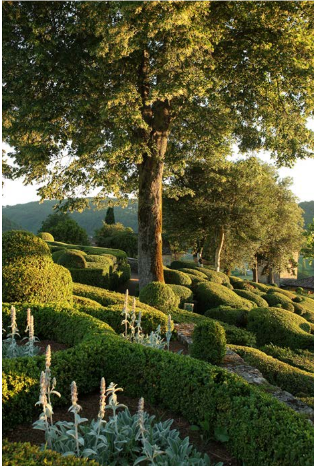
LE BASTION AU COUCHER DU SOLEIL