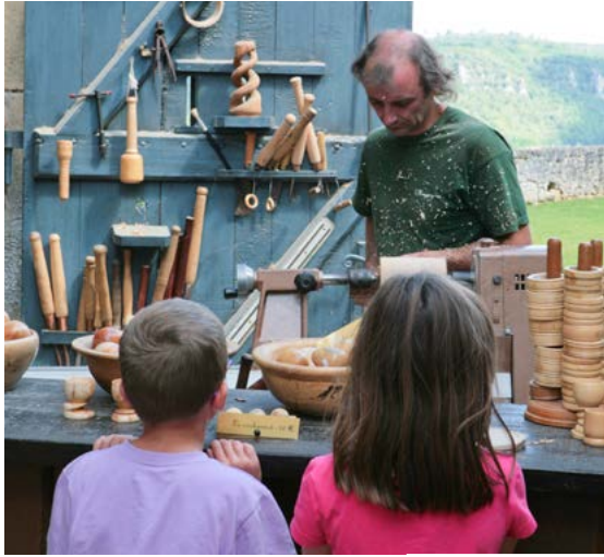
LE TOURNEUR SUR BUIS